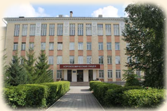
Консалтинговый центр МБОУ АКЛ имени Ю. В. Кондратюка