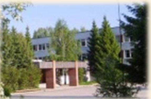
МКОУ "ИМЦ" Ново- сибирского района

Министерство образования, науки и инновационной политики Новосибирской области