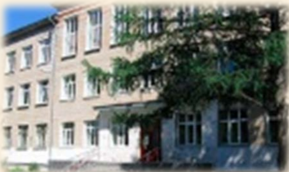
МБОУ «Гимназия № 3 в Академгородке»